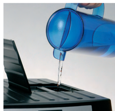
Gemakkelijk te bedienen, een ruime productkeuze en trendy

De Barista is ontworpen en in productie genomen om een vaste voet te krijgen in het horecasement. Kort na de introductie is de Barista al een kleurrijke machine. De Barista is bijzonder vorm gegeven, snel en eenvoudig in het gebruik. De Barista is leverbaar in twee uitvoeringen, Presso Bean Et Speedmix. Door zijn opvallende kleursamenstelling is er altijd wel een plekje voor deze machine. Beide modellen zijn gemakkelijk van elkaar te onderscheiden door de verschillende kleurstellingen van hun verlichte panelen: oranje voor de Presso Bean en blauw voor de Speedmix uitvoering. Het speciale Latte-Aero-Mix systeem zorgt ervoor dat elk kopje qua smaak maar ook in uiterlijk altijd perfect is. Het bijvullen van de productcontainers gaat moeiteloos, de speedmix uitvoering wordt standaard geleverd met 3 productcontainers. Door het unieke maalsysteem kan ook in de Barista Presso Bean uitvoering de sterkte van elke koffiedrank afzonderlijk worden ingesteld. Kortom een ideale "Barman"